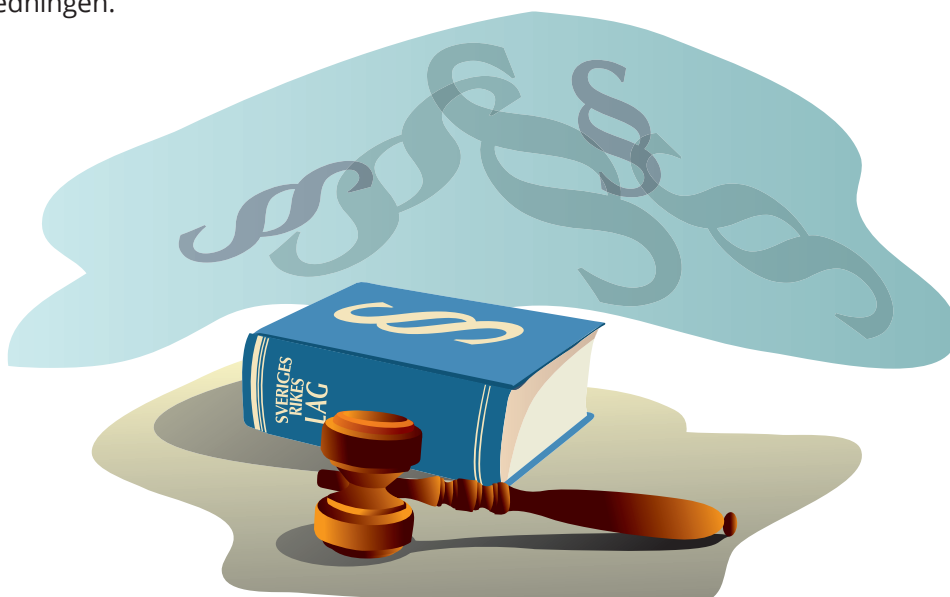
Bild 1. Det är viktigt att arbetsgivare, innehavare och arbetstagare känner till de regler och riktlinjer som gäller.

Säkerhetskulturen på en arbetsplats och inom en organisation är avgörande för hur arbetet utförs. Med säkerhetskultur avses de värderingar, attityder och beteenden som arbetsgivare och arbetstagare har i fråga om säkerhet och arbetsmiljö och som visar sig i hur man agerar. En stark säkerhetskultur innebär att säkerheten prioriteras på alla nivåer inom organisationen och att detta arbete styrs och stötts av ledningen.