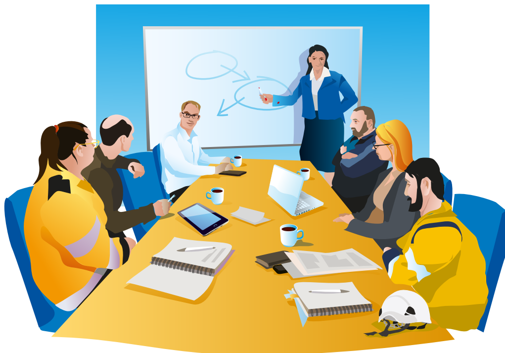
Bild 3. Även personer som planerar och leder arbeten kopplade till elektrisk ström behöver ha rätt kompetens.