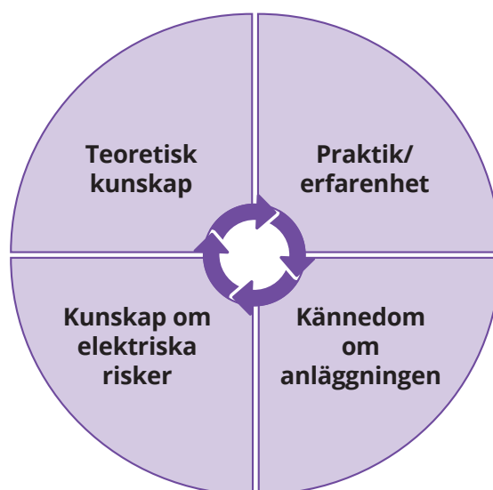
Bild 2. För att en person ska anses vara fackkunnig krävs teoretisk kunskap, praktisk erfarenhet, kunskap om elektriska risker samt kännedom om anläggningen. Samtliga fyra kriterier ska vara uppfyllda.

Vid arbeten där det finns eller kan uppstå en risk för elektrisk fara krävs att de som planerar, leder och deltar i arbetet ska vara fackkunniga eller instruerade samt ha erfarenhet av arbetsuppgifterna och kännedom om den aktuella anläggningen eller anläggningstypen. De ska även ha genomgått en EBR ESA-utbildning enligt Krav 09:26. Utbildningen ska hållas av en utbildningsanordnare och en certifierad EBR ESA-lärare som båda har godkänts av Energiföretagen.